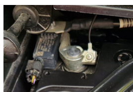
Borna "-" (minus)