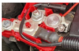
Borna "+" (plus)